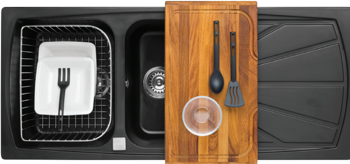
Living 500 可滑动式菜板 不锈钢篮

不要将刚刚从加热器具（有时高达500°C）上取下的水壶零件或咖啡壶直接放到水槽中。